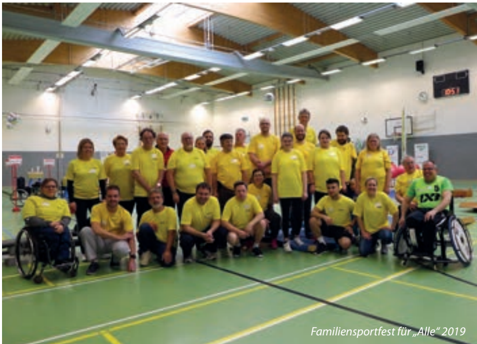
Familien sportfest für „Alle“ 2019

Besonderheiten: Tageslehrgang, inklusive Verpflegung. Der „Ausweis Prüfer*in“ für das Deutsche Sportabzeichen